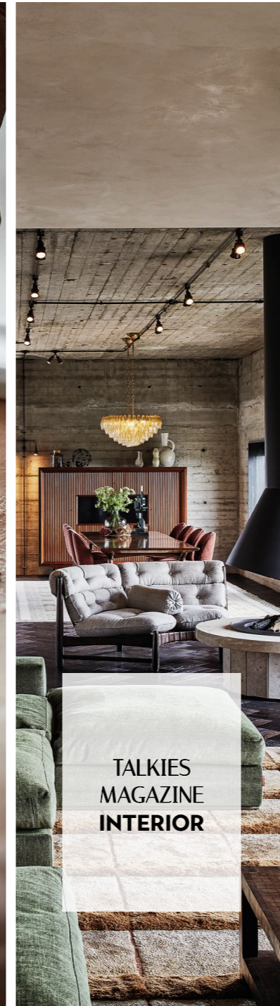
TALKIES MAGAZINE INTERIOR