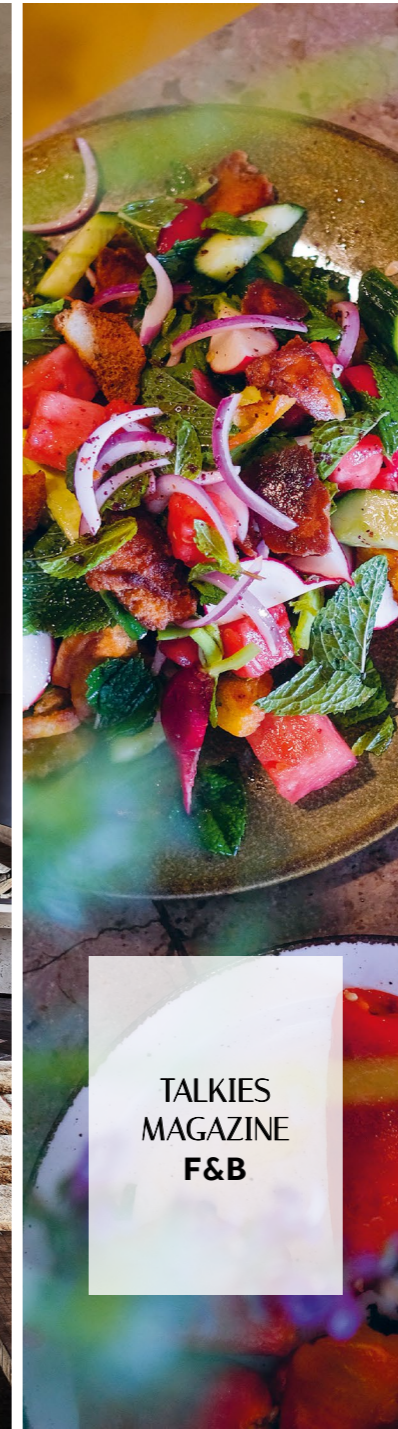
TALKIES MAGAZINE F&B