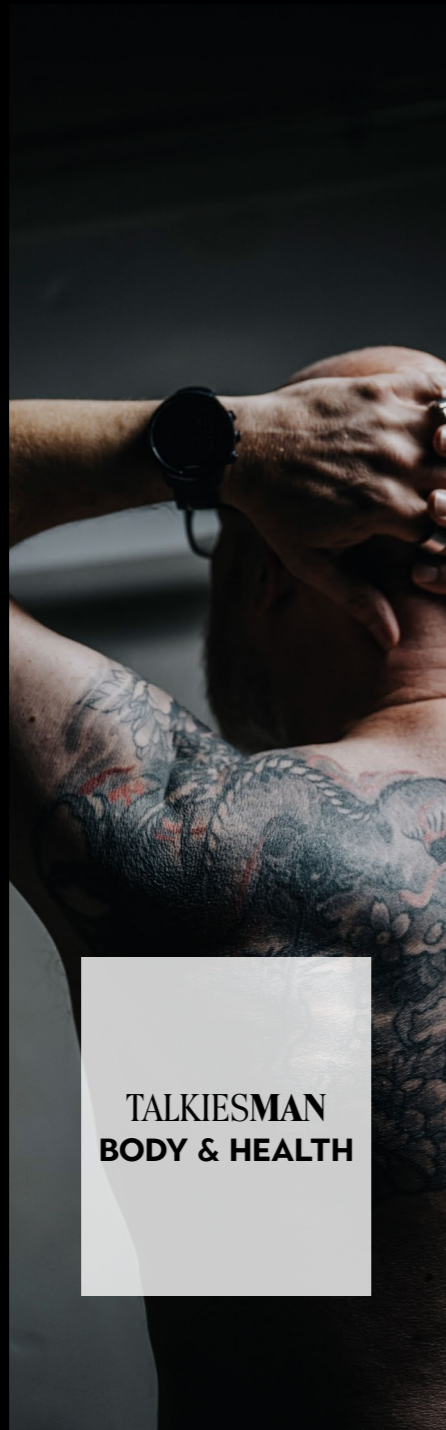
TALKIESMAN BODY & HEALTH