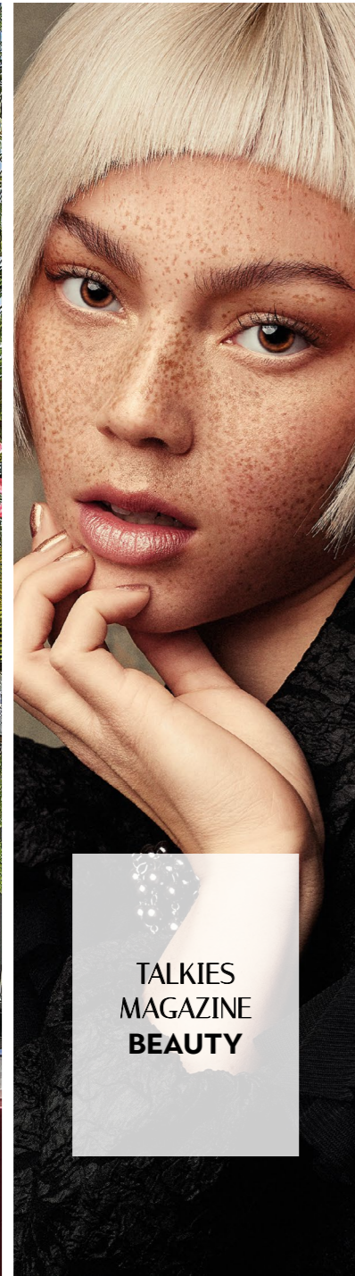
TALKIES MAGAZINE BEAUTY