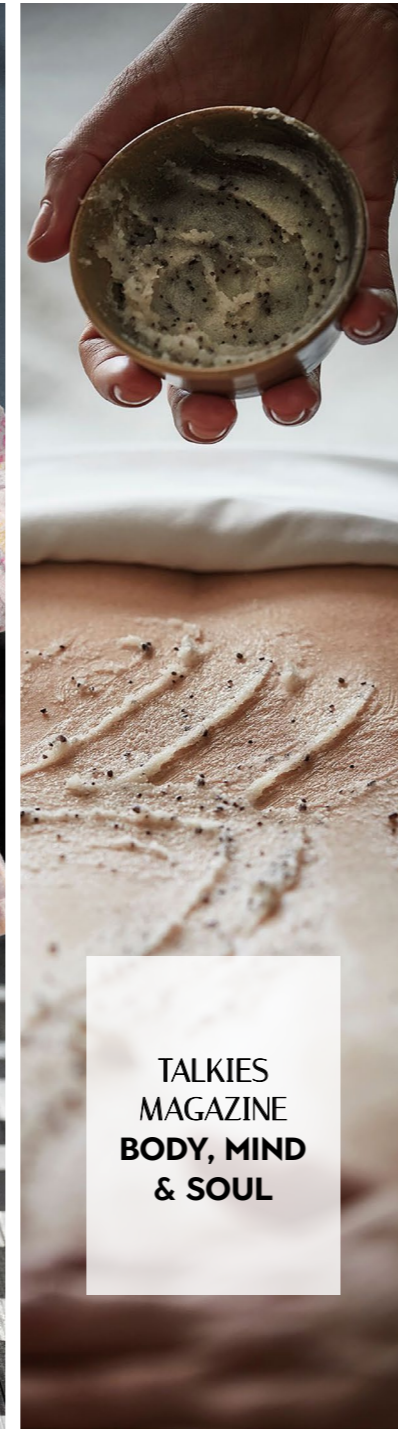
TALKIES MAGAZINE BODY, MIND & SOUL