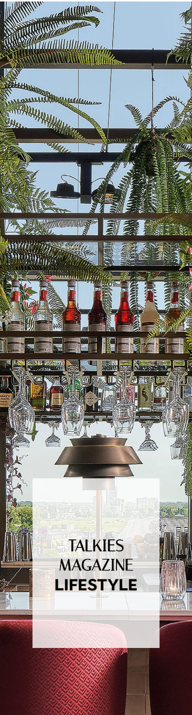
TALKIES MAGAZINE LIFESTYLE