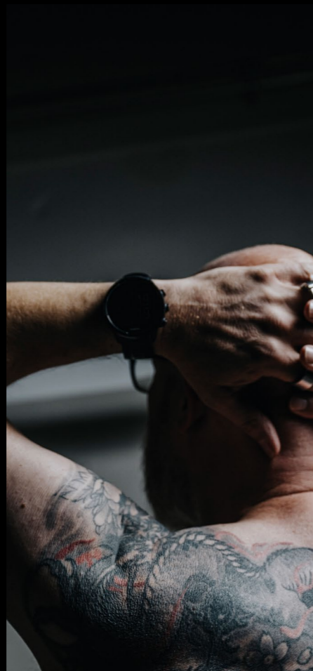
TALKIESMAN BODY & HEALTH